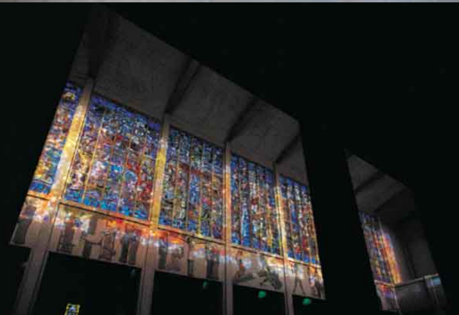
Vue de la nef.

Peu avant 1900, le Père Jean-Baptiste de Chémery (1861-1918), capucin du couvent de Blois, découvre la lecture des écrits du franciscain saint Léonard de Port-Maurice (mort en 1751) et la pratique quotidienne des trois « Ave Maria », usage en honneur depuis le xiii e siècle et recommandé par plusieurs saints. Dès lors, le Père Jean-Baptiste n'aura de cesse de diffuser cette pratique : en 1902, il obtient de l'évêque de Blois,