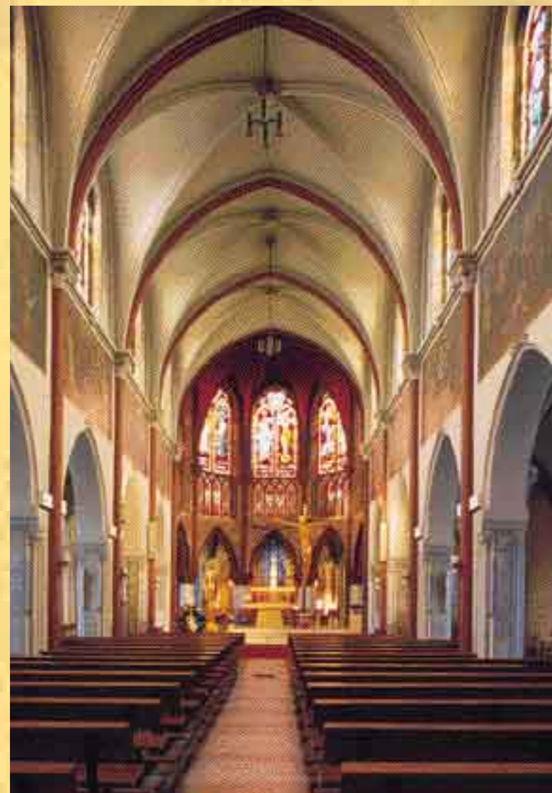
Vue intérieure de la nef et du chœur.

« La couleur est reine et elle a le droit de préséance sur tout autre élément, avec sa contribution de poésie et de mystère. »