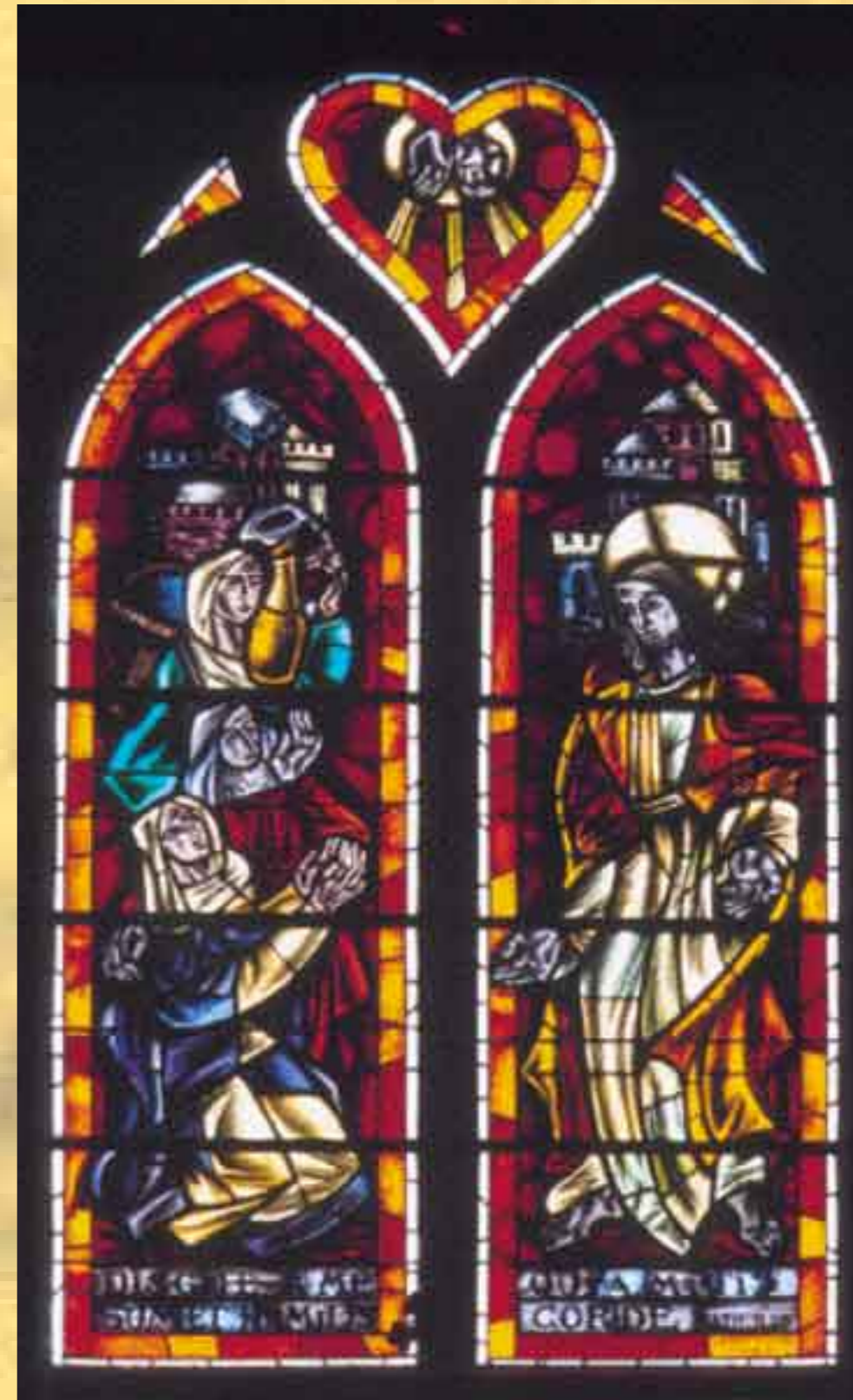
Verrière haute du chœur.

« La couleur est reine et elle a le droit de préséance sur tout autre élément, avec sa contribution de poésie et de mystère. »