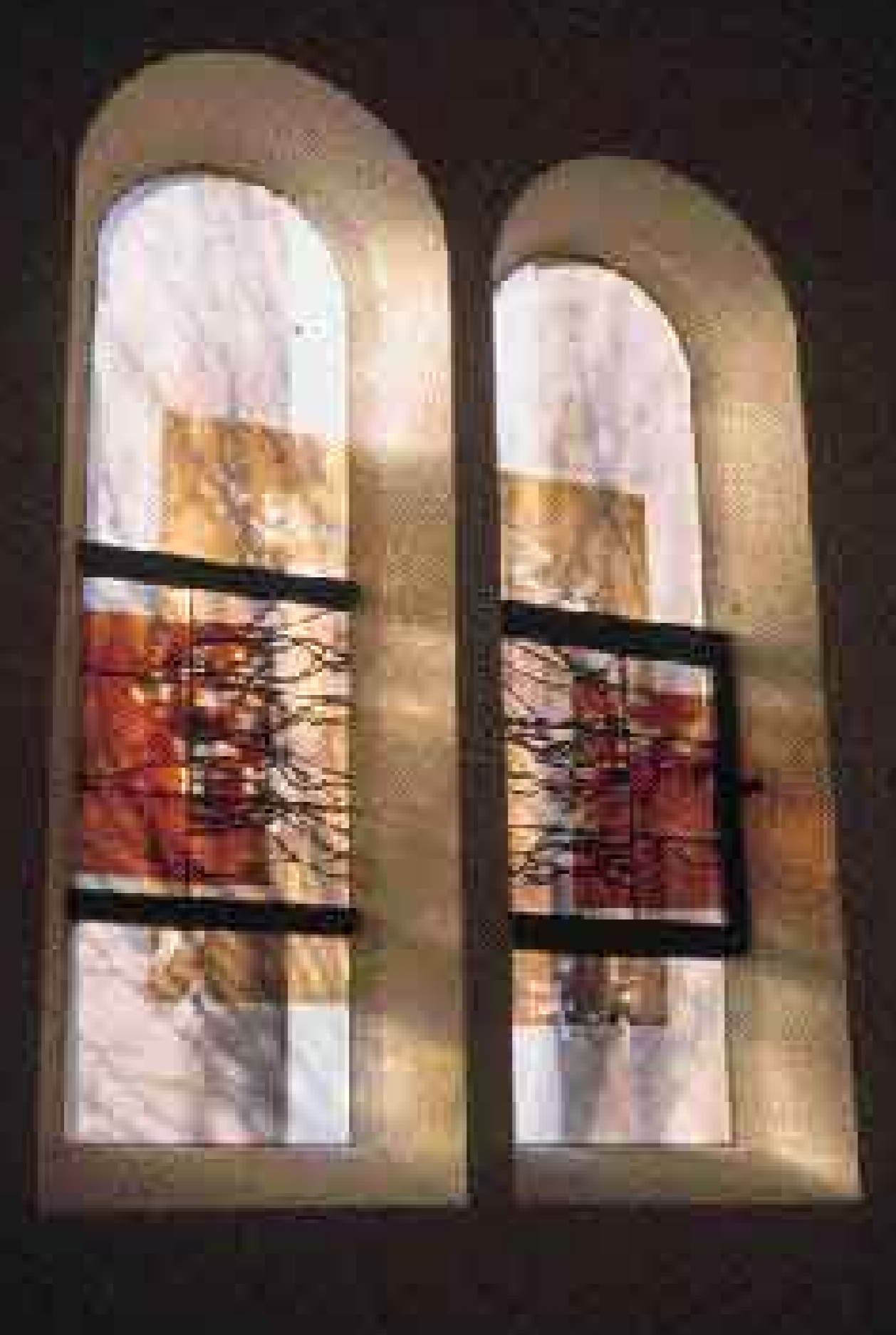
Double page : chapelle des Petites Sœurs des Pauvres, Orléans (Loiret), 1989, verre antique et verre industriel.

« Je travaille en permanence la dissociation entre la couleur et le graphisme. Entrelacs et plans s'interpénètrent sans qu'aucun n'exerce de domination. Le jeu subtil d'ombres et de lumières superposées, confrontées, offre une vision nouvelle du vitrail, art de peintre, oscillant entre la surface effective de l'œuvre et l'atmosphère du lieu. Un art libéré des habitudes de métier, où les réalisations en perpétuelle évolution s'accommodent du risque que comporte chaque nouvelle étape. »