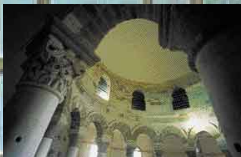
Jean Mauret, église de Neuvy-Saint-Sépulchre, 1998, vitraux de la coupole et détails.